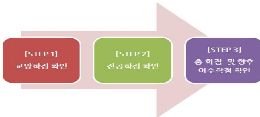
[그림 5] 학점은행제 학습설계 순서도