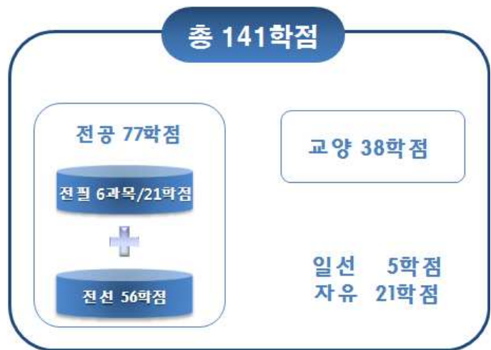
[그림 11] '예시 3'의 총학점 구성도

✓ 자유 과목 : 전공, 교양, 일선의 학습 구분 관계없이 학습자가 희망하는 학습과목을 선택하여 수강할 수 있음 (단, 중복과목 제외).