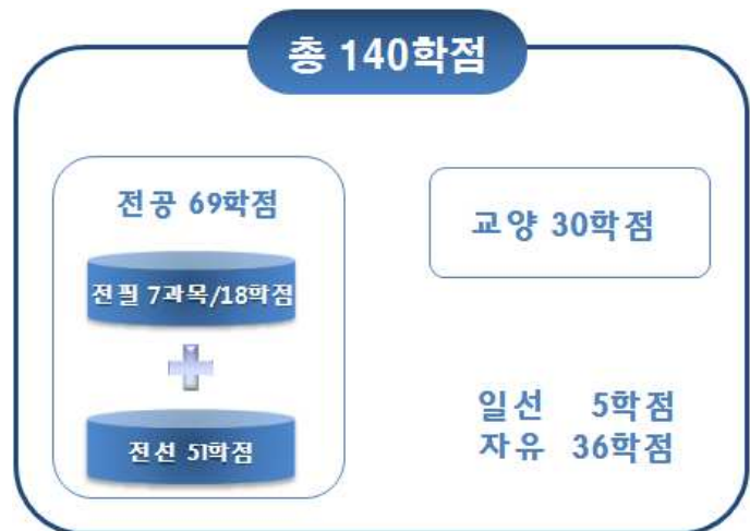
[그림 9] '예시 1'의 총학점 구성도