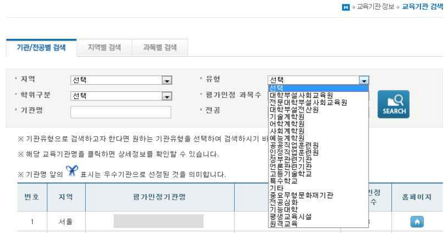
[그림 3] 교육훈련기관 검색 메뉴

(1) 기관/전공별 검색 : 대학부설평생교육원, 전산원, 원격교육기관 등 기관유형에 따른 교육훈련기관 검색 및 전공에 따른 교육훈련기관 검색