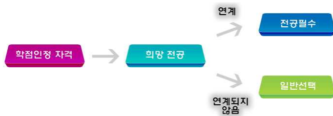
[그림 4] 자격 학습구분 결정 기준