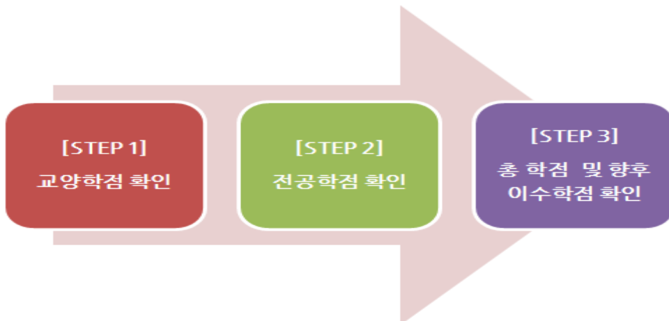
[그림 4] 학점은행제 학습설계 순서도