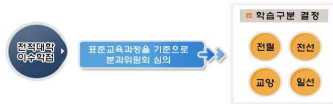
[그림 7] 학점인정대상학교 학습구분 결정 기준

희망 학위 및 전공의 표준교육과정을 기준으로 분과위원회의 심의를 거쳐 학습구분 결정됨.