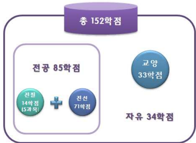
[그림 10] '예시 2'의 총학점 구성도