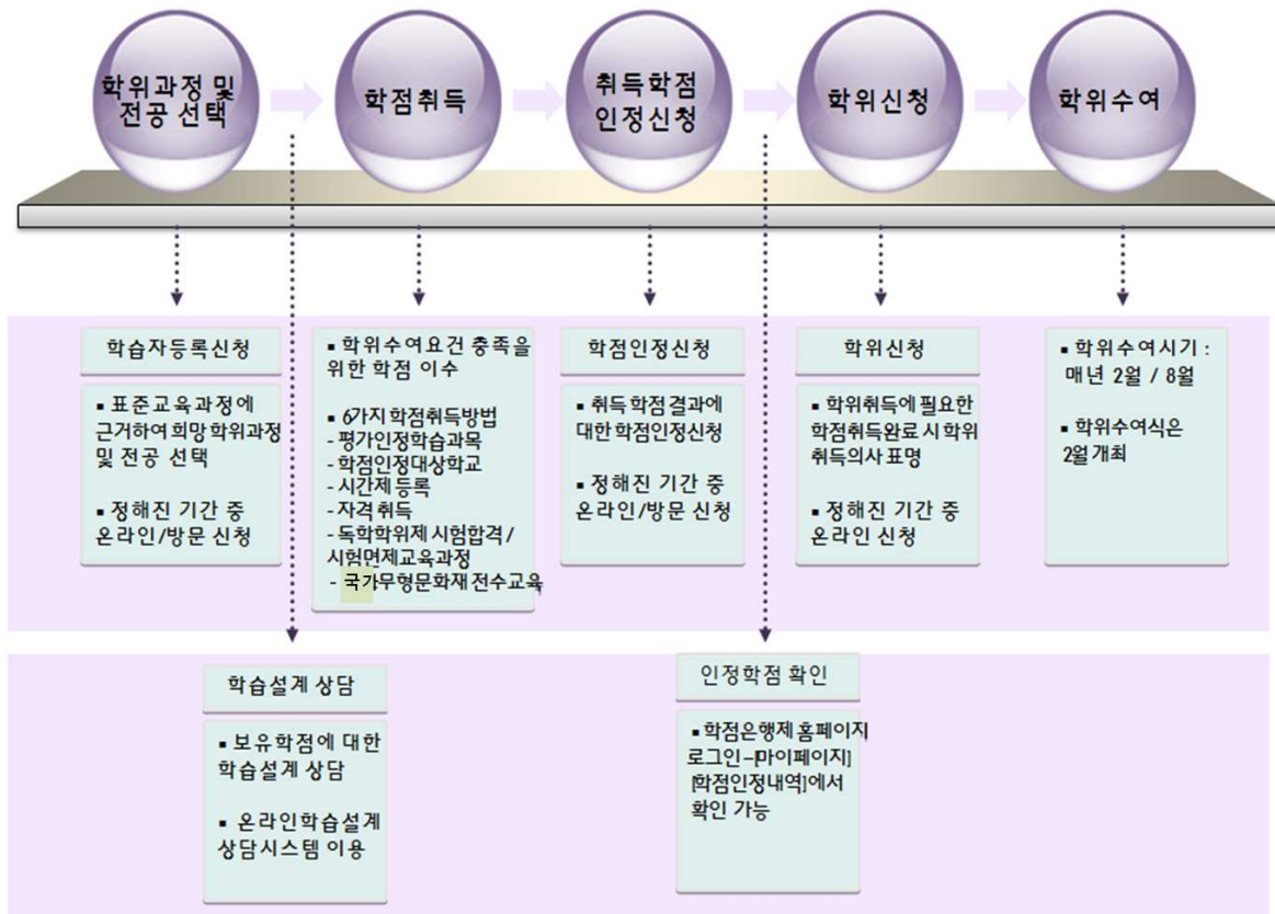
[그림 1] 학점은행제 흐름도

□ 일반적으로 아래와 같은 절차로 학점은행제 학위과정을 진행할 수 있습니다.