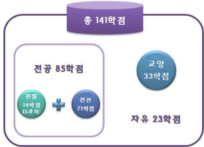
[그림 9] '예시 1'의 총학점 구성도

✓ 교양 과목 : 전공별 이수 교양 과목이 정해져 있지는 않으므로 학점은행제 [표준교육과정]-[교양] 과목을 평가인정 학습과정 혹은 시간제등록으로 이수하거나, 각 대학에서 교양으로 개설한 과목을 시간제등록으로 이수할 경우 교양으로 인정받을 수 있음.