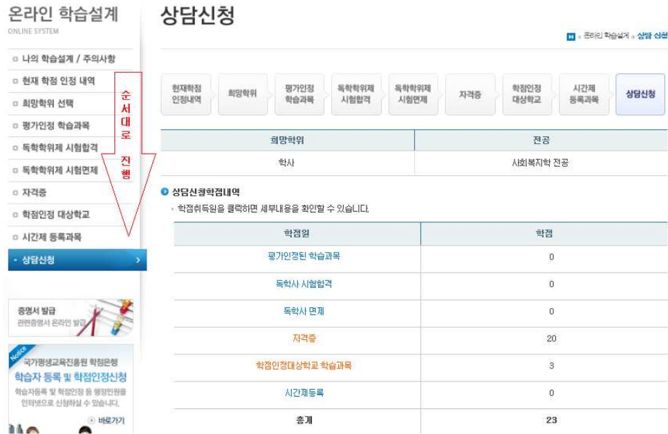
[그림 13] 온라인 학습설계 시스템